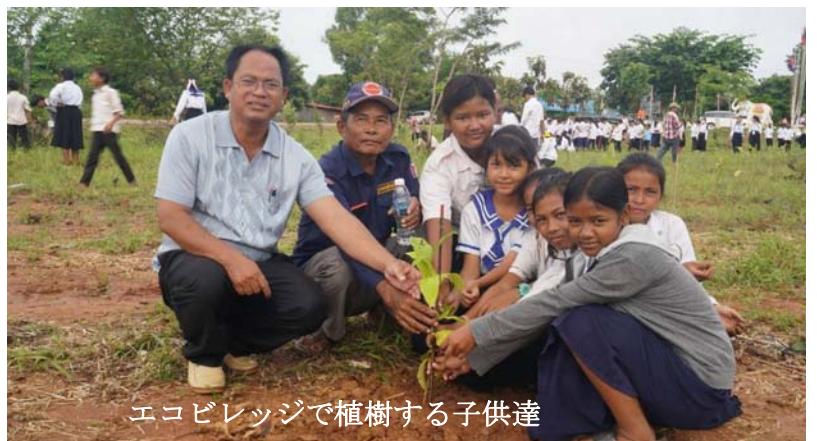
エコビレッジで植樹する子供達