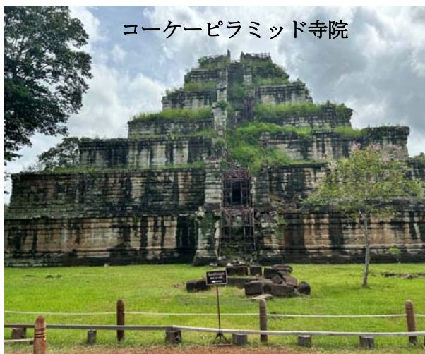
コーケーピラミッド寺院