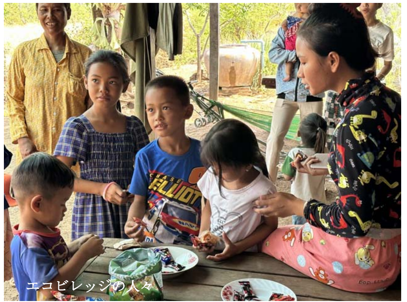
エコビレッジの人々