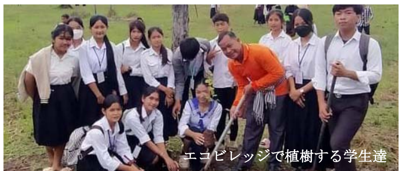
エコビレッジで植樹する学生達