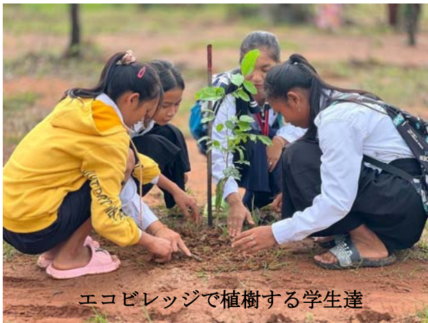
エコビレッジで植樹する学生達