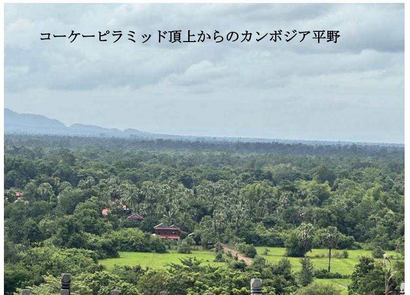
コーケーピラミッド頂上からのカンボジア平野