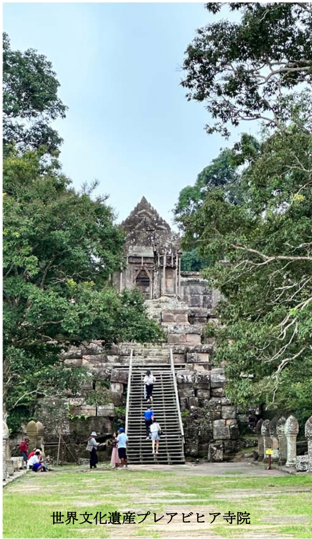
世界文化遺産プレアビヒア寺院